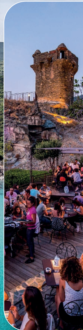
Soirée B2B atypique ▶