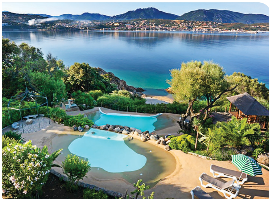
Propriano. L'hôtel Marina & Spa ouvre ses portes à des réunions stylées.