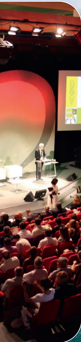
◀ Auditorium en cœur de ville